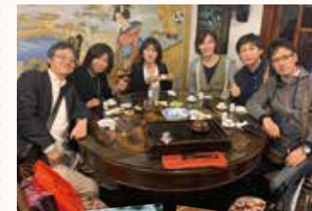
台湾の食事は、小籠包、ツミレスープ、火鍋など。予想以上に日本人好みで安くて美味! 時差は1時間で、過ごしやすい気候でした。テレビや雑誌では得ることができない体験ができて、刺激をたくさん受けてきました。

美味しいものを食べると、自然と笑顔になり、アドレナリンがでるんですね。グッドアイデアがいくつも思いついたりしました! 貴重な経験をできたこと、一緒に仕事をしている仲間に、あらためて「謝謝(ありがとう)」!